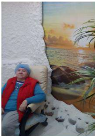
Галотерапия («Соляная пещера»)

В отделении имеется широкий спектр приборов и аппаратов для магнитотерапии (МАГ, Алмаг, Магнитер), магнитосветотерапии, термотерапии, магнитоинфракрасной терапии, светотерапии, а так же многое другое: