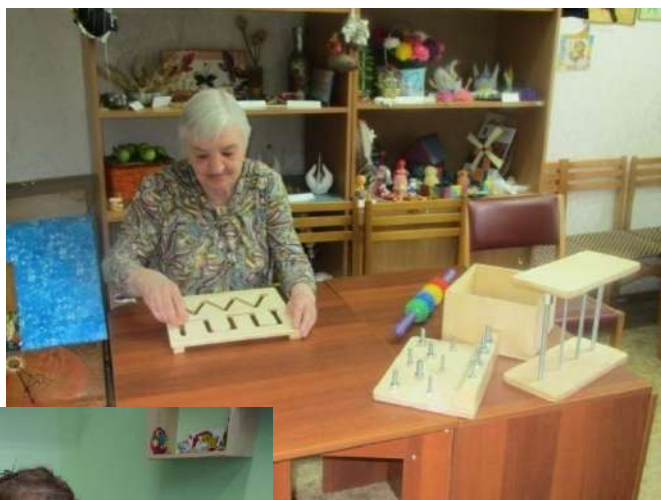
Развивающий комплекс «ДОН»